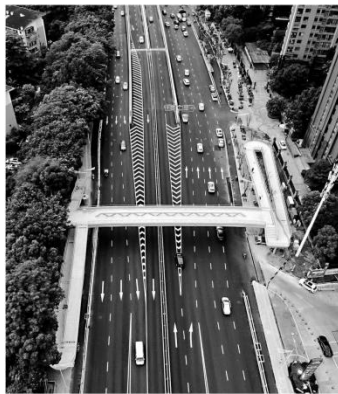
闽江大道过街天桥,设有双向坡道及双楼梯,可满足行人和非机动车出行需求

也是城区首座曲面过街天桥。”据福州城投集团所属市域城乡建设集团项目负责人介绍,目前城区过街天桥桥面均采用平直设计,而该桥梁却采用了难度更高的鱼腹式曲面设计,通过钢箱梁桁架组合,使得桥面略微隆起,增加了小坡度,让桥梁线性饱满,整体观感更富有曲线变化。此举既兼顾了天桥的实用性及安全性,也让桥梁外观与周边的景观更加协调。 值得一提的是,为了让天桥更好地与爱琴海商圈夜景相融合,后续天桥上还将布置精美的灯带造景,与爱琴海周边的霓虹灯交相辉映,构成一幅绚丽多彩的夜间画卷,促进夜色经济的发展。